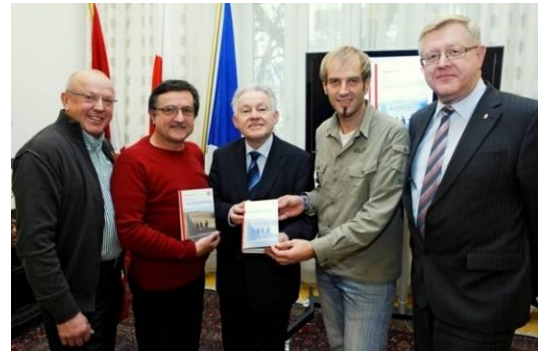
Buchübergabe im Landhaus am 1.12.2012