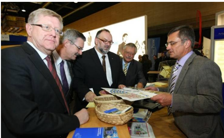
Der abschließende Messerundgang führte auch zum Informationsstand des bayerischen Landtags.