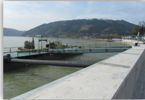
Schiffsanlegestelle Grein nach dem Dammbau