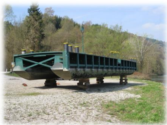
Aushub des Pontons und Reparatur des Schwimmkörpers an Land.