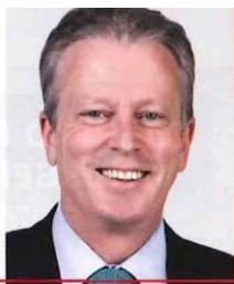
Dr. Reinhold Mitterlehner Bundesminister für Wirtschaft, Familie und Jugend

Urlaub am Wasser hat seit jeher eine besondere Anziehungskraft und bietet hohen Erholungswert. Mit der Donau verfügt Österreich über ein weltweit bekanntes Naturjuwel, das auch für den Wandertourismus großes Potenzial bietet.