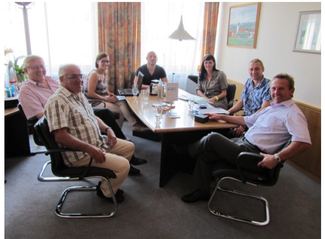
Gemeindebereisung in Kellberg/Thyrnau