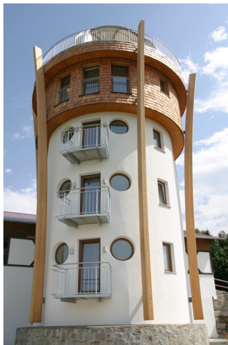
Höchster in einen Golfplatz integrierter Abschlagplatz der Welt