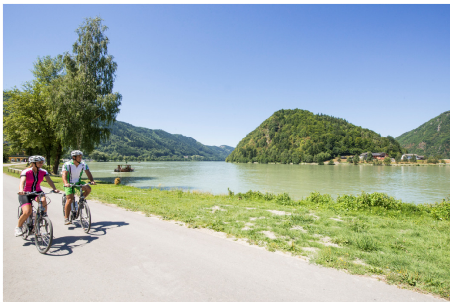
Donauradweg bei der Schlögener Schlinge

Für eine neue Präsentation als Markendestination Donau OÖ wurde gemeinsam mit dem OÖ Tourismus ein neues Fotokonzept erarbeitet. Leistungsgegenstand ist die Erstellung von Fotografien zu den Themen Donauradweg (E-Bike), Donausteig, Kultur (ganzjährig), Wassererlebnis (Schifffahrt) sowie Kulinarik. Für jedes Thema sind 2 Hauptbilder sowie mindestens 15 weitere Bilder zur Verwendung für Tagebuch, Internet, Polaroids und PR- Maßnahmen zu erstellen. Im Juni wurde für die Fotografie der Donau-Themen Rad, Wandern und Kultur eine Ausschreibung im Sinne der neuen Marken-Strategie durchgeführt. Der Auftrag erging dazu an Herrn Hermann Erber. Im August wurden gemeinsam mit dem OÖ Tourismus die ersten Donauradweg-Aufnahmen geschootet. Erste Bilder dazu gibt es unter www.facebook.com/ooe.donauradweg .