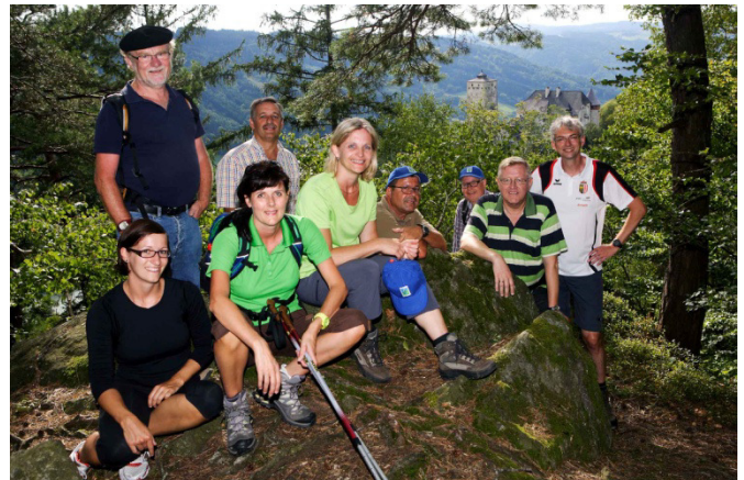
Die fröhliche Wandergruppe am Donausteig mit dem Schloss Marsbach im Hintergrund