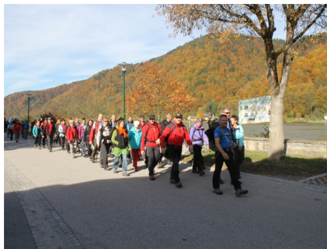
24h Wanderung am Donausteig