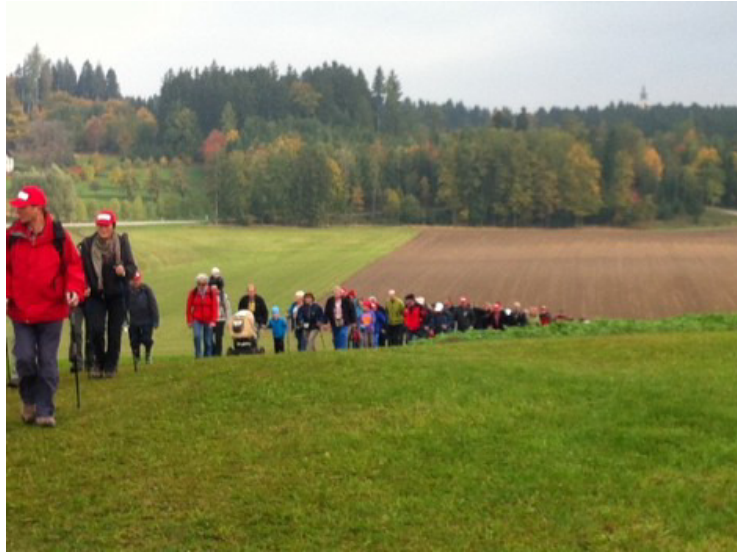
Radio OÖ-Wanderung in Altenfelden

Am 13. Oktober 2013 nahmen rund 6.000 Teilnehmer bei der Radio-Oberösterreich-Wanderung unter dem Motto „Durch den Wildpark zur Donau“ in Altenfelden teil. Die 19km lange Wanderung startete auf dem Marktplatz von Altenfelden und führte über Kirchberg ob der Donau wieder zurück nach Altenfelden. Die Mittagsrast fand im Feuerwehrdepot Kirchberg statt, wo auch die Werbegemeinschaft Donau OÖ mit einem Informationsstand zur Donau vertreten war.