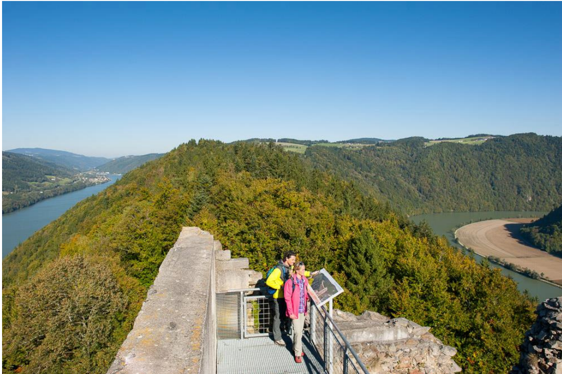
Ruine Haichenbach mit Blick auf die Schlägener Schlinge

Für eine neue Präsentation als Markendestination Donau OÖ wurde gemeinsam mit dem OÖ Tourismus ein neues Fotokonzept erarbeitet. Leistungsgegenstand ist die Erstellung von Fotografien zu den Themen Donauradweg (E-Bike), Donausteig, Kultur (ganzjährig), Wassererlebnis (Schifffahrt) sowie Kulinarik. Für jedes Thema sind 2 Hauptbilder sowie mindestens 15 weitere Bilder zu jedem Thema zur Verwendung für Tagebuch, Internet, Polaroids und PR- Maßnahmen zu erstellen.