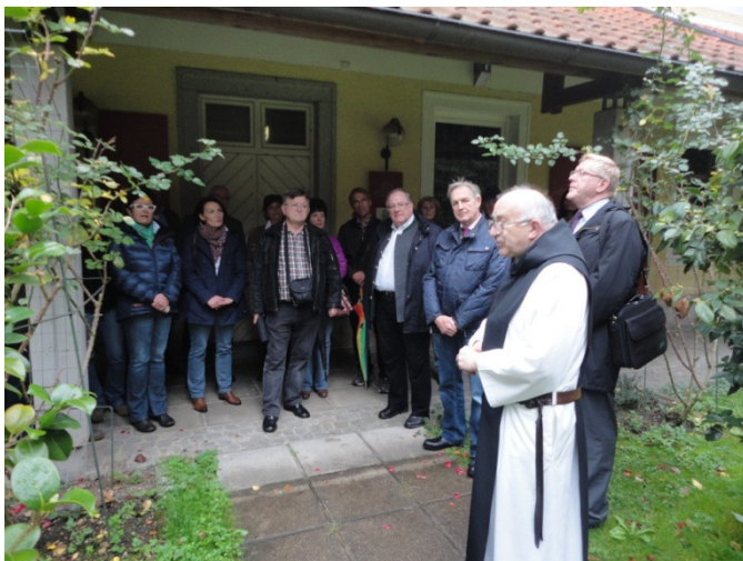
Führung im Stift Engelszell