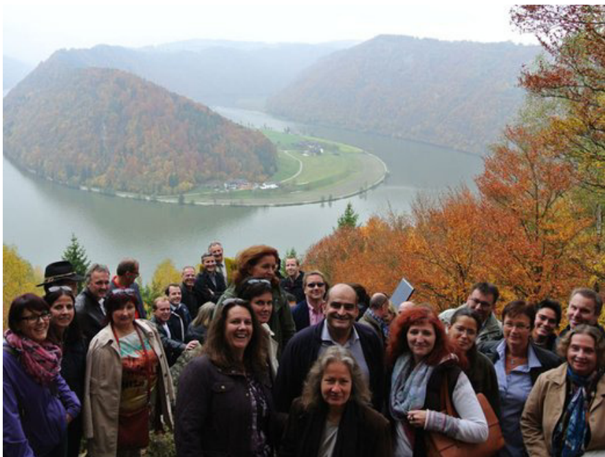
Oberösterreichs Tourismuslehrer genießen den herbstlichen Ausblick bei der Schlägener Schlinge

Lehrerinnen und Lehrer der Tourismusschulen Bad Ischl, Bad Leonfelden und der Höheren Lehranstalt für Tourismus und Hotelfachschule Weyer trafen sich am 23. Oktober 2013 an der Donau. Nach einem Spaziergang zum „Schlögenger Blick“ an der Donau erfuhren die Teilnehmer Interessantes über das „Kursbuch Tourismus Oberösterreich“, die Innovationsprojekte „Marke Oberösterreich“ und „Leuchttürme“ sowie das Konzept des Donausteiges. Dieses Treffen ermöglicht den Lehrern und Lehrerinnen regelmäßig aktuelle Entwicklungen in Oberösterreich kennen zu lernen und an die Schüler weiterzugeben.