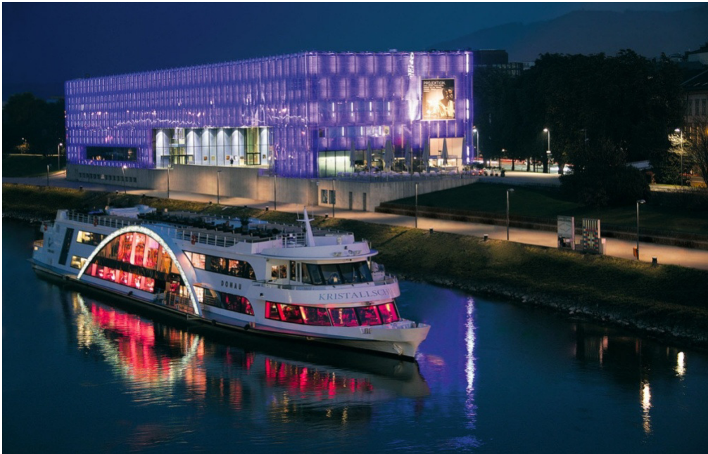
Herbst- und Winterfahrten auf dem Kristallschiff