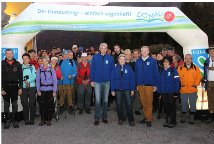
Die Teilnehmer der 24h Wanderung